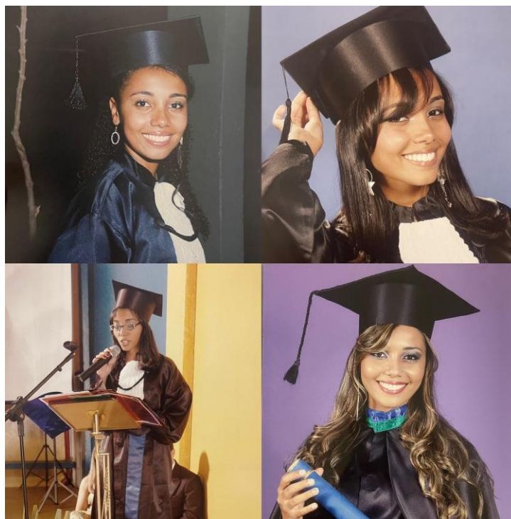
Figura 3 - Trajetória na educação, minhas formaturas do ensino fundamental, médio e primeira graduação em pedagogia

Freire 3 : “A educação não transforma o mundo. Educação muda as pessoas. Pessoas transformam o mundo” (Freire, 1987).