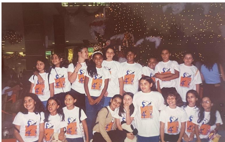
Figura 1 - Formatura da 4ª Série do 1º grau na Escola classe 04 do Núcleo Bandeirante (2000)

O privilégio racial é uma característica marcante da sociedade brasileira, uma vez que o grupo branco é o grande beneficiário da exploração, especialmente da população negra. E não estamos nos referindo apenas ao capitalismo branco, mas também aos brancos sem propriedade dos meios de produção que recebem seus dividendos do racismo. Quando se trata de competir no preenchimento de posições que implicam recompensas materiais ou simbólicas, mesmo que os negros possuam a mesma capacitação, os resultados, são sempre favoráveis aos competidores brancos. (Gonzalez, 2020 p. 46).