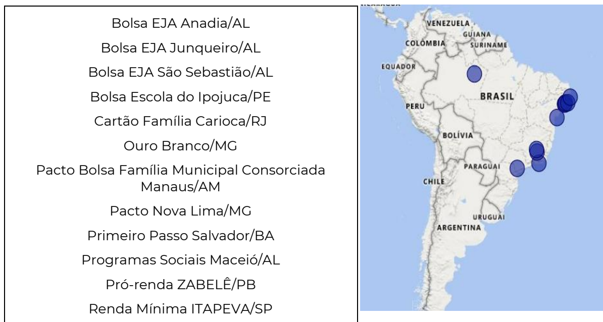
Quadro 7: Programas sociais avaliados com distribuição no mapa

Conforme detalhado no item anterior, foram elencados 12 (doze) programas sociais de transferência de renda, com caráter continuado, no âmbito municipal, operacionalizados pela Caixa, com algum pagamento realizado em 2022, além de considerar pagamentos mensais aos beneficiários: