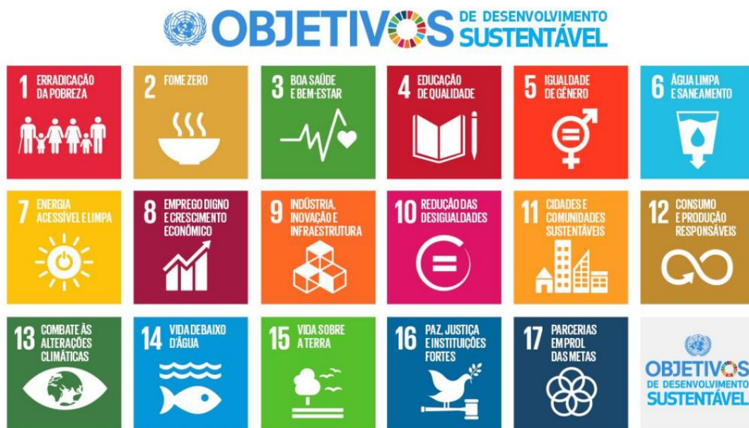
Figura 1: Objetivos de Desenvolvimento Sustentável