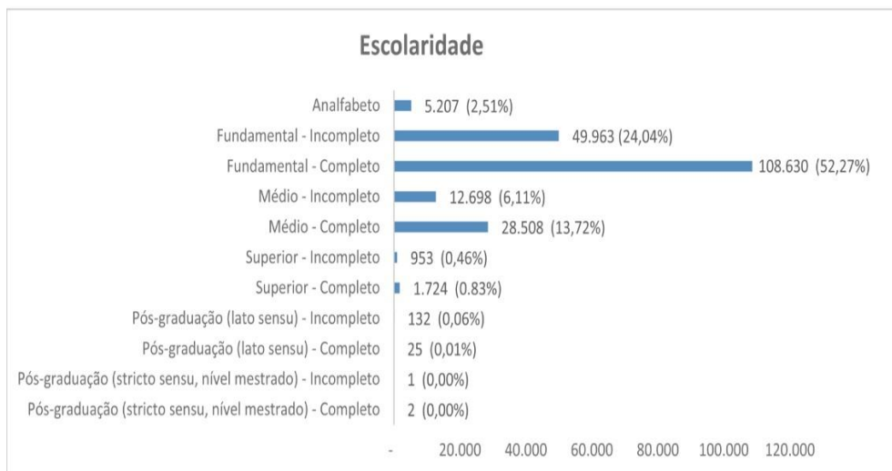
Figura 4 – Escolaridade das pessoas privadas da liberdade no Brasil