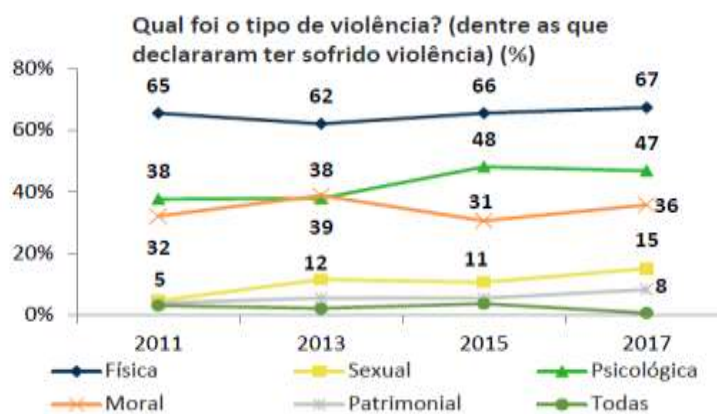
Gráfico 1 – Percentual de violência em 2017

No relatório de pesquisa de 2017 constatou-se que a violência psicológica representou 47% dos casos de violência, ficando atrás somente da violência física. Inference-se ainda do Gráfico 1 que o resultado de 2017 quase não se alterou quando comparado com a estatística de 2015. Contudo, verificou-se um aumento significativo da agressão psicológica quando comparada com percentual de 2011 e 2013.