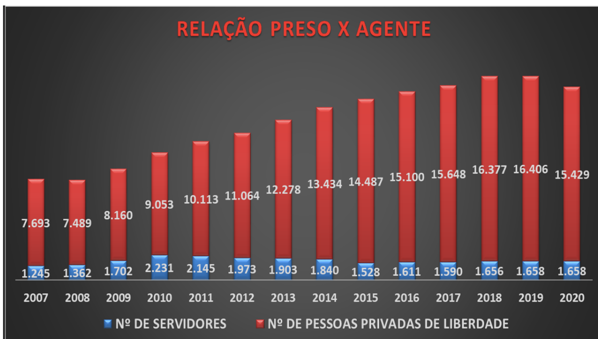
Gráfico 7: Evolução comparativa da relação de número de servidores e número de pessoas presas

Na medida em que esse encarceramento em massa observado no Distrito Federal, tem como fatores, o exponencial crescimento do aprisionamento nos últimos 15 anos, associado ao não acompanhamento do crescimento da estrutura prisional, resultando assim numa significativa deflação da capacidade operativa do sistema prisional, mais conclusões vêm à tona sobre a função do sistema de justiça.