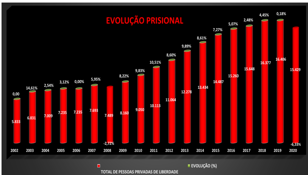
Gráfico 1: Evolução do número de aprisionamento e da taxa de encarceramento

Como se observa, de 2002 a 2009, a taxa de evolução da massa carcerária do Distrito Federal chegou a um pico de 8,22%, com dois anos de estabilidade no crescimento, 2002 e 2006, e um decréscimo em 2008 de 2,72%, agravando-se a partir de 2010, chegando a um pico máximo de 10,51% em 2011. Em dezesseis anos, a população carcerária triplicou, saindo de um universo de 5.833 (cinco mil, oitocentos e trinta e três) internos para 16.406 (dezesseis mil, quatrocentos e seis) presos em 2019, confirmando também no Distrito Federal os efeitos do fenômeno do encarceramento em massa.