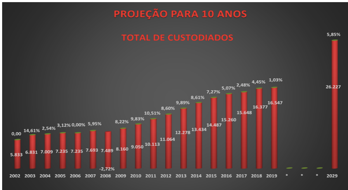
Gráfico 2: Projeção de 10 anos do crescimento do número de encarceramento e da taxa de aprisionamento

O quadro comparativo do INFOPEN (2016) entre as unidades federativas do Brasil ainda nos levam a concluir que o Distrito Federal adotou agressivamente essa política de encarceramento massivo, ao percebermos que a taxa de aprisionamento do DF (510,3% para cada 100 mil habitantes), chegou a ser a quinta maior do país, logo em seguida à São Paulo.