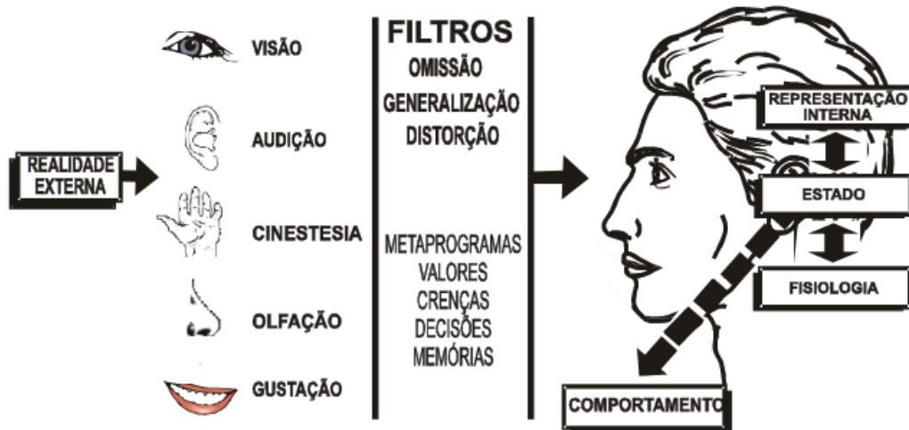
Figura 2: Modelo da PNL de percepção e comunicação